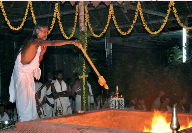
Śrī Tathâta lors du Mahayaga 2009 en Inde.

Aujourd'hui, Śrī Tathâta, maître spirituel qui se consacre inlassablement à aider les êtres humains à élever leur niveau de conscience et qui peut être considéré comme le continuateur de Śrī Aurobindo, a la même révérence pour les Vedas. Si Śrī Aurobindo a écrit de façon inspirée sur le