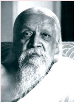
Śrī Aurobindo (1872-1950).